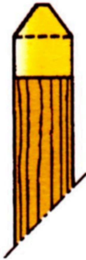
Circuit départemental de randonnée